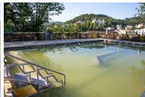
Toto: Becher's bar Grandhotelu PUPP, bazén Saunia s vířivkami, Termální bazén Saunia s léčivou vodou.